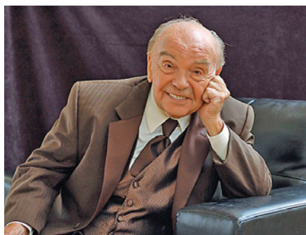
Владимир Яковлевич Шаинский