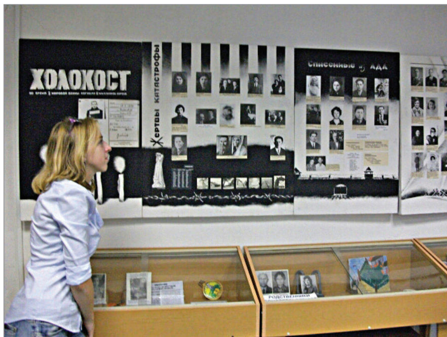
В музее истории Ярославской еврейской общины им.М.И.Стерина

ше едва знал по имени и всего значения которых для судеб немецкого народа я конечно не понимал. Я говорю о марксизме и еврействе».