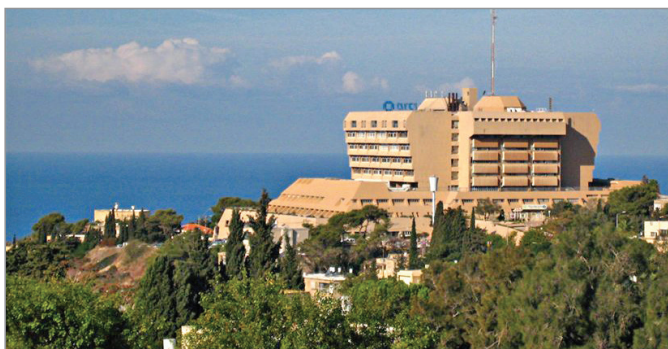
Медицинский центр «Кармель» в Хайфе

Впервые в истории мировой врачебной практики, врачи отделения сердечной хирургии Хайфского госпиталя в медицинском центре «Кармель», под руководством доктора Офира Амира совершили очередной кровавый беспредел.