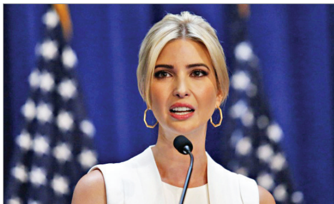
Она молилась на могиле Любавического Ребе, чтобы Всевышний послал победу ее отцу.

благоволений»). В одном из таких застолий приняли участие около тысячи гостей — почти все родственники большой семьи Кушнир.