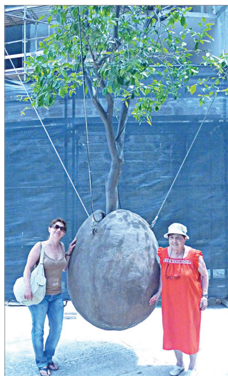
Апельсиновое дерево, растущее из камня – символ города Яффо

Посетили много экскурсий. Незабываема панорама Иерусалима, были у Стены Плача. Побывали в Тель-Авиве, в древнем городе Яффо с очень узкими улочками.