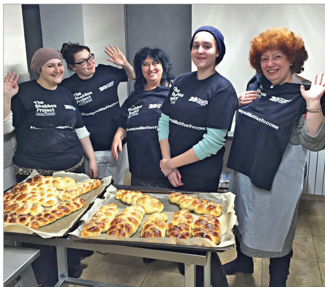
Для Всемирного шаббата наши женщины испекли вкусные халы

Если посмотреть на еврейскую историю то мы увидим что на протяжении веков, наши враги всегда старались искоренить нас именно через субботу. Один из запретов, которые постановили греки перед историей чуда Хануки, это запрет на соблюдение Субботы. В более поздние времена в разных странах именно суббота становилась тем камнем преткновения, из-за которого на нас начинались гонения. В XX веке, когда евреи в разное время начали эмигрировать в США, именно суббота стала главной проблемой. Выходным днем, как и в большинстве стран мира, было воскресенье, и суббота была рабочим днем, к тому же самым прибыльным. И евреям приходилось или работать в субботу или терять работу.