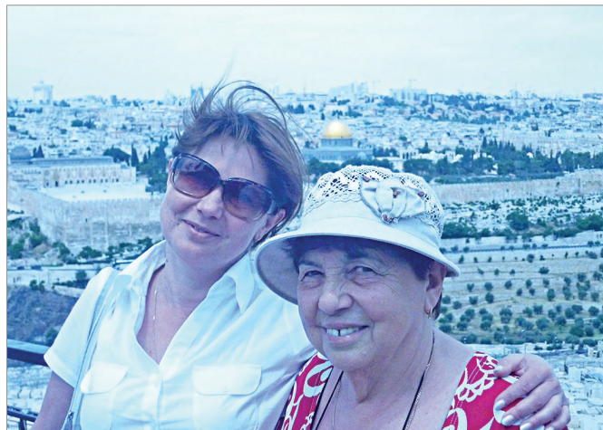
На фоне Храмовой горы