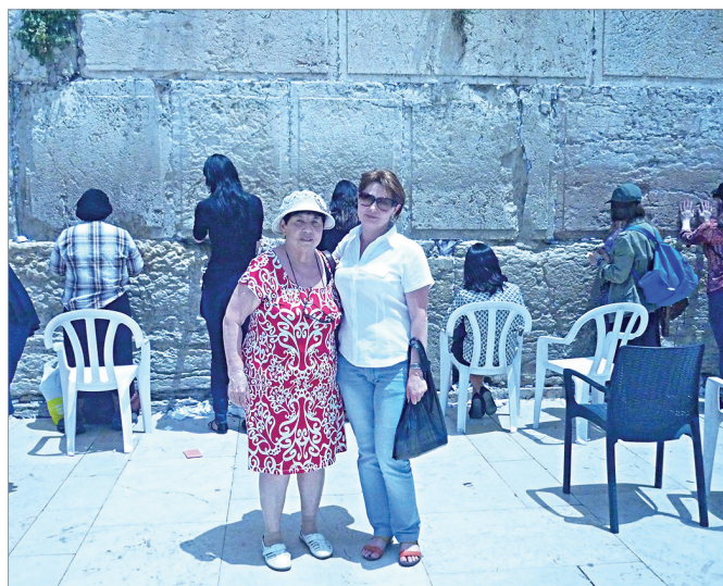
У Стены Плача

Очень интересная была экскурсия в мужской монастырь, так называемый «приют молчальников». Там живут 30 монахов – самому младшему 26 лет, старшему – за семьдесят. Полдня они молятся, другую часть дня работают – выращивают виноград, из которого делают вино, и оно продается. И, самое главное, они должны молчать. Считается, что говорить можно только с Б-гом, остальное – суэта.