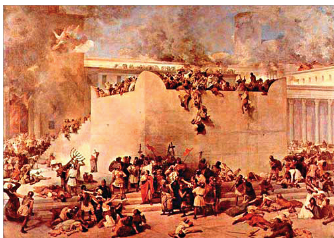
Разрушение Второго храма во время Первой Иудейской войны (70 г. до Р. Х.). Художник Ф. Айец, 1867.

«Между теснинами» ( בין המצרים ) – так называются три особенные недели между 17 Тамуза и 9 Ава (в этом году с 24 июля до 14 августа). В это время Закон накладывает на еврея ряд ограничений. Каждая часть года имеет свои особенности и не похожа на другие времена. Она несёт в себе уникальный духовный заряд, по-особенному пробуждающий нашу душу и заставляющий её звучать той единственной мелодией, которую нельзя услышать в другое время года. Есть время, пробуждающее радость – Суккот. Есть время, возвращающее нам ту особую связь с Творцом, которая была во время Синайского Откровения – Шавуот.