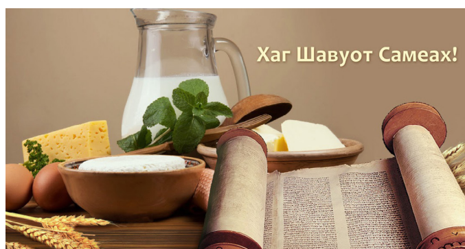
Хаг Шавуот Самеах!

Одним из самых неоднозначных праздников для меня является праздник Шавуот. Давайте сделаем «виртуальный» эксперимент. Представим себе человека, который взял Тору и хочет сверить по ней все еврейские праздники. Насколько написанное о них в Торе соответствует тому как их отмечают сейчас, спустя 3 тысячелетия.