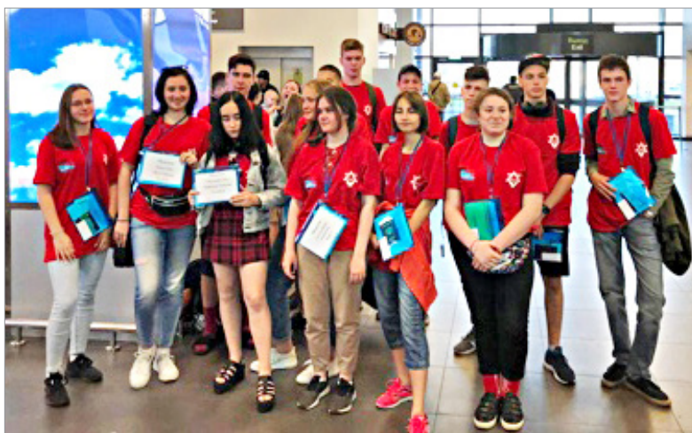
В аэропорту «Жуковский»