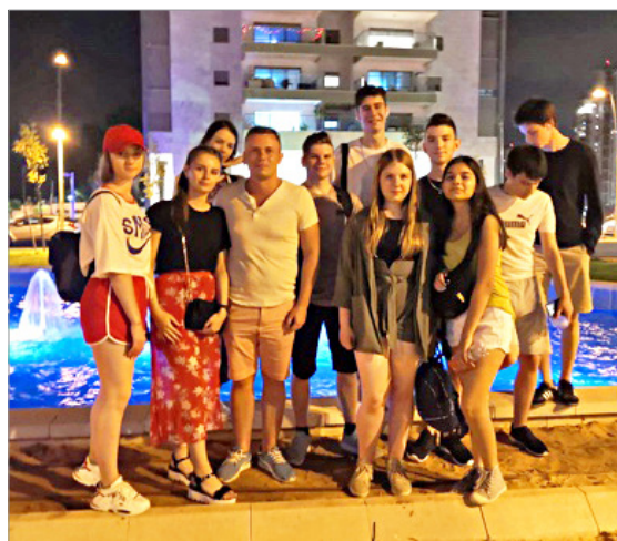
ברוך הבא לישראל