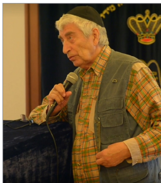
Борис Львович Аренберг