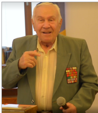
Мотл Калманович Пеймер